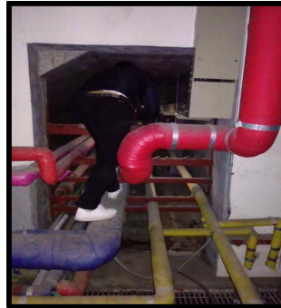
· 배관 피트실 점검