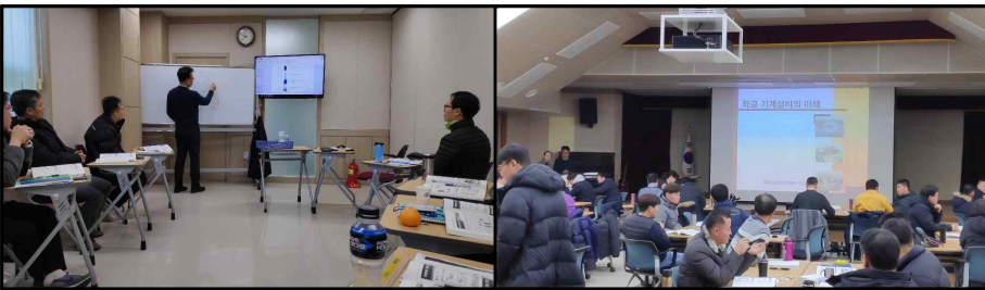
· 전입자 직무교육 현장