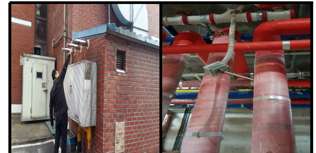
· 보일러 급배기통 점검