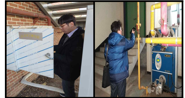
· 가스메타함 점검