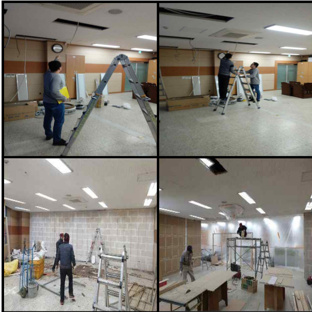
· 교육시설관리센터 확충 공사 현장