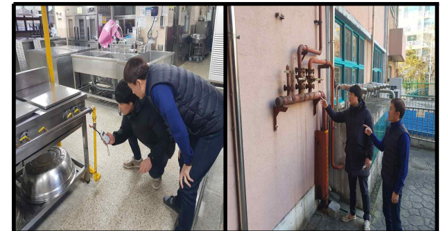
· 급식실 가스관 점검